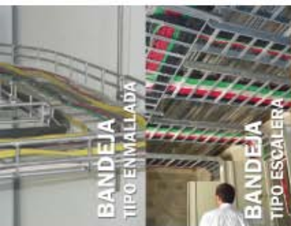
BANDEJA TIPO ENMALLADA